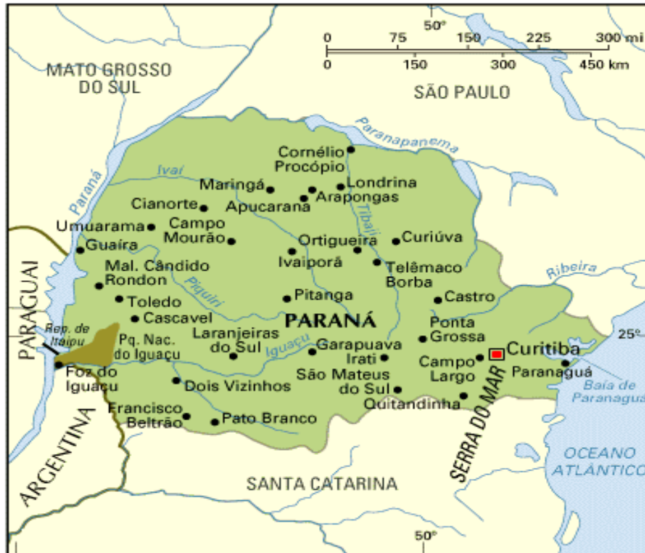
FIGURA 01 – Mapa do Estado do Paraná e suas Regiões